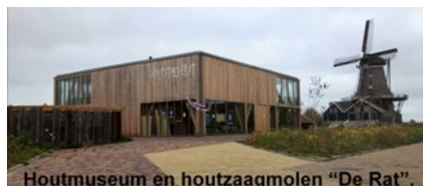
Houtmuseum en houtzaagmolen "De Rat".

Tegen 14.00 uur wordt de groep wederom opgesplitst en gaat de ene helft eerst naar de molen en de andere groep krijgt een rondleiding in het houtmuseum. De groepen zullen na ongeveer een uur wisselen van bestemming.