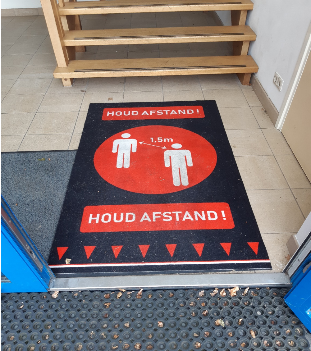
Inloopmat ingang horeca