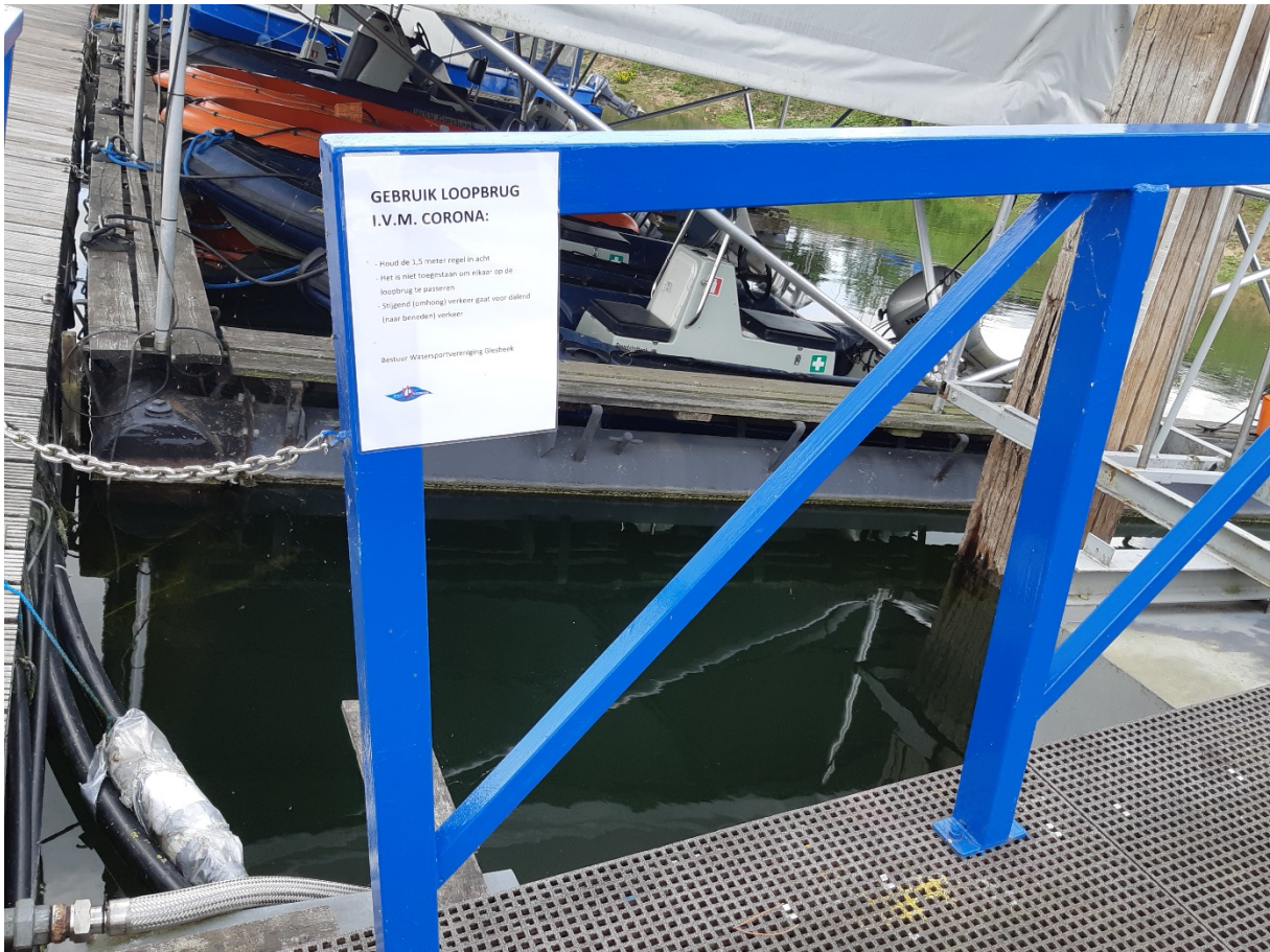
Loopbrug (steigende gedeelte). Aan de linkerkant van de loopbrug zijn de gedragsregels aangeplakt.